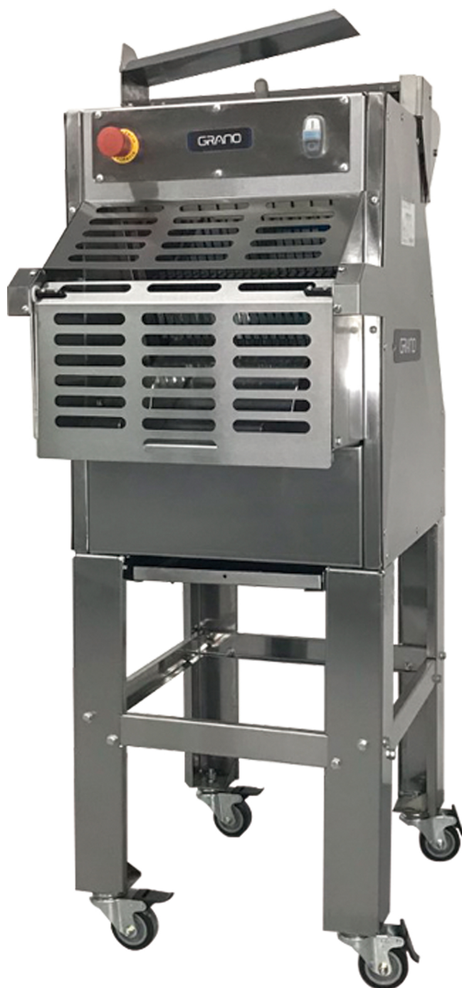
Fatiadora de Pães FP12 | FP14